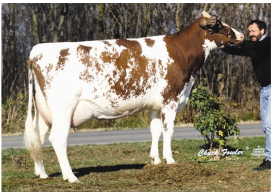
KELLCREST HAPPY SPIRIT FIFTH DAM