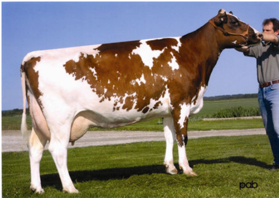
LACHUTE ROAD H S SALEM FOURTH DAM